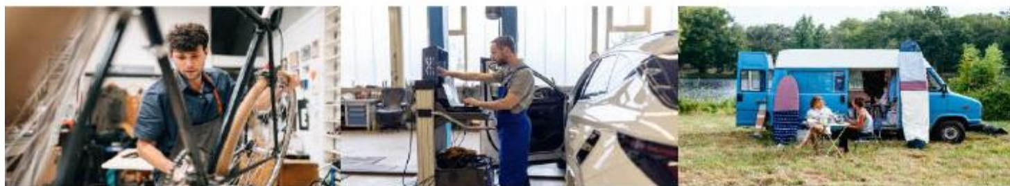
Omscholen tot Basis Fietstechnicus

In samenwerking met het UWV zijn er speciaal voor zij-instromers drie kortdurende leerwerktrajecten ontwikkeld. Na het met succes afronden van de opleiding én de bijbehorende stage is er uitzicht op een baan.